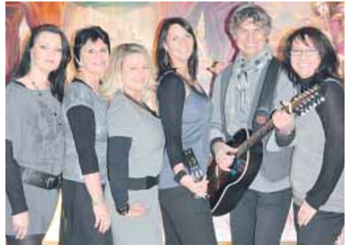
Haben eine neue CD: die Sevenhill Singers