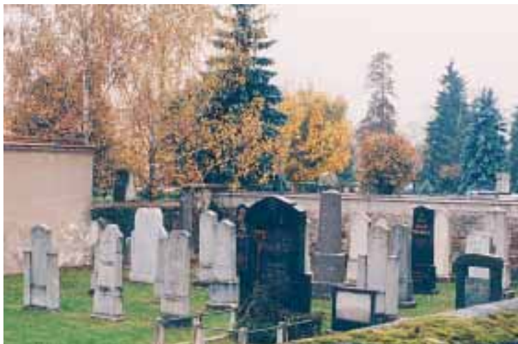
Der israelitische Friedhof in St. Ruprecht wird von der Stadt Klagenfurt betreut. Mauer und Eingangstor werden in Abstimmung mit der Kultusgemeinde und dem Bundesdenkmalamt restauriert.