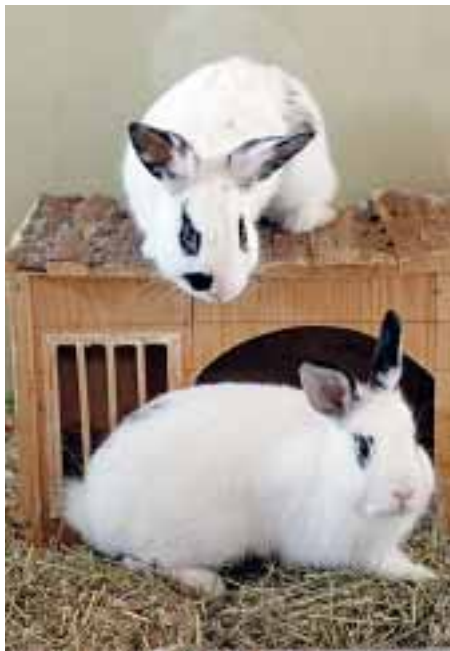
Die beiden schwarz-weißen Kaninchen-Herren suchen gemeinsam ein schönes Plätzchen. Die Langohren sind erst ein halbes Jahr alt.