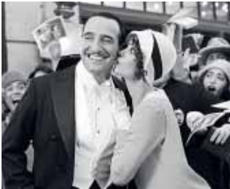
Preisgekrönt! Sehenswert! „The Artist“. Termine auf www.volkskino.com