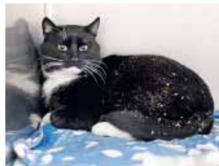
Diese Katzendame ist Mitte Jänner am Rautkogel gefunden worden. Seitdem wartet sie im TiKo auf ihren Besitzer.