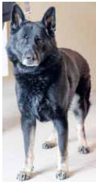
Schäferhund „Marko“ ist der ideale Familienhund. Der Rüde fährt gerne Auto und mag Kinder, er sucht dringend eine neue Familie!