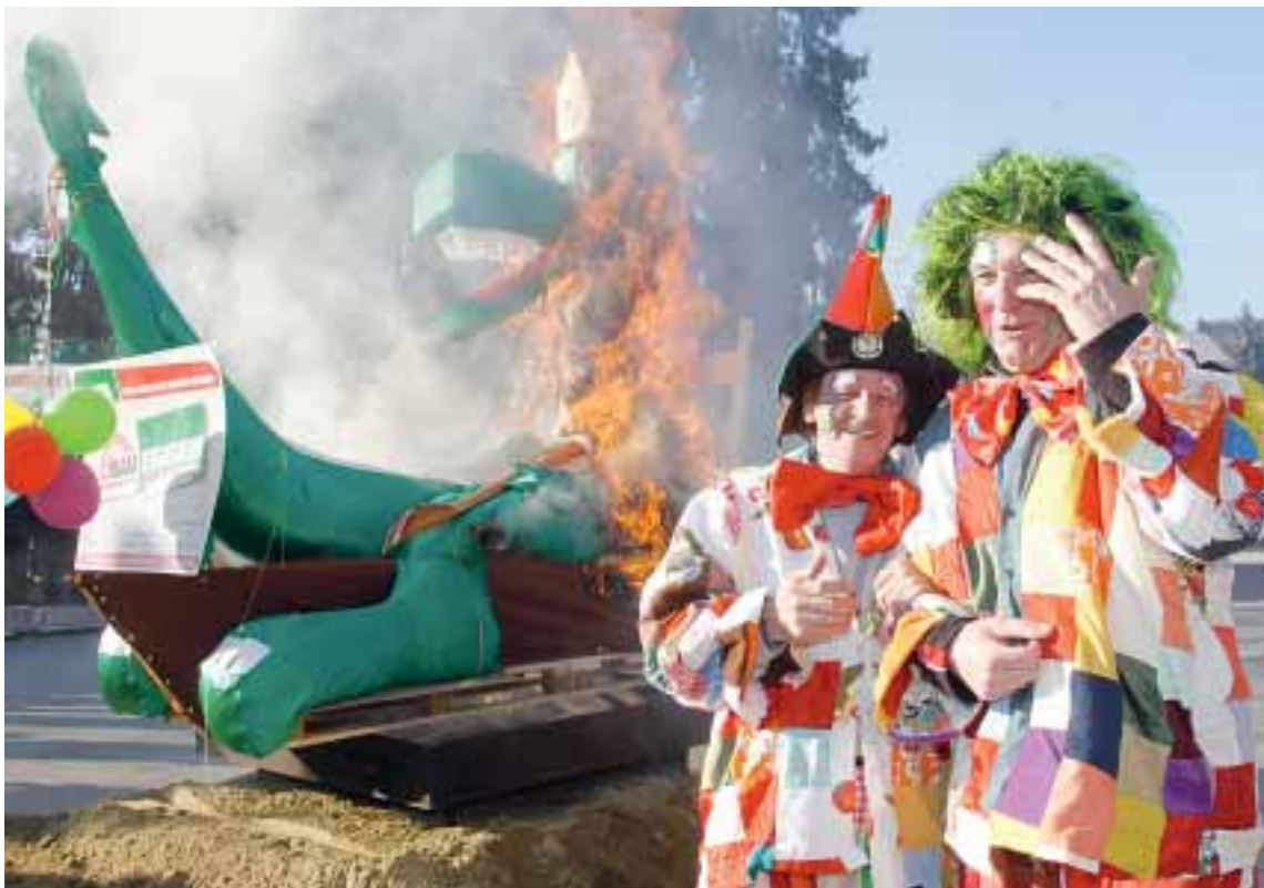
Höhepunkt am Faschingdienstag in Waidmannsdorf: das Verbrennen des Fasching.

Wer nicht bis Faschingdienstag warten kann, am Faschingsamstag, dem 18. Februar, gibt es auf dem Neuen Platz schon ein Narrenprogramm aus dem Westen.