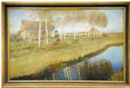
Gemälde der Maler aus der „Worpsweder Künstlerkolonie“ sind bis Ende Februar in der Stadtgalerie zu sehen.