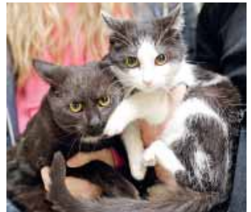
Das Katzenpärchen würde sich über ein gemeinsames, gemütliches Zuhause sehr freuen. Wer nimmt die hübschen Samtpfoten zu sich?

Alle Infos zu den heutigen Tieren unter Telefon 43 5 41 0 und im Internet unter www.tiere-in-not.at